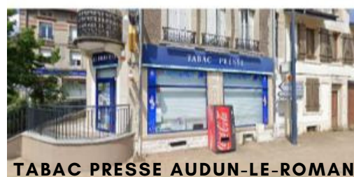
TABAC PRESSE AUDUN-LE-ROMAN