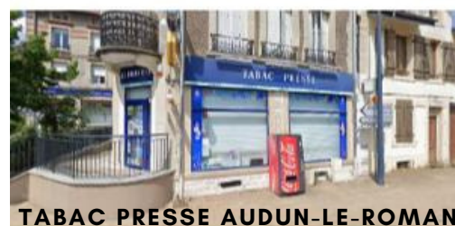
TABAC PRESSE AUDUN-LE-ROMAN